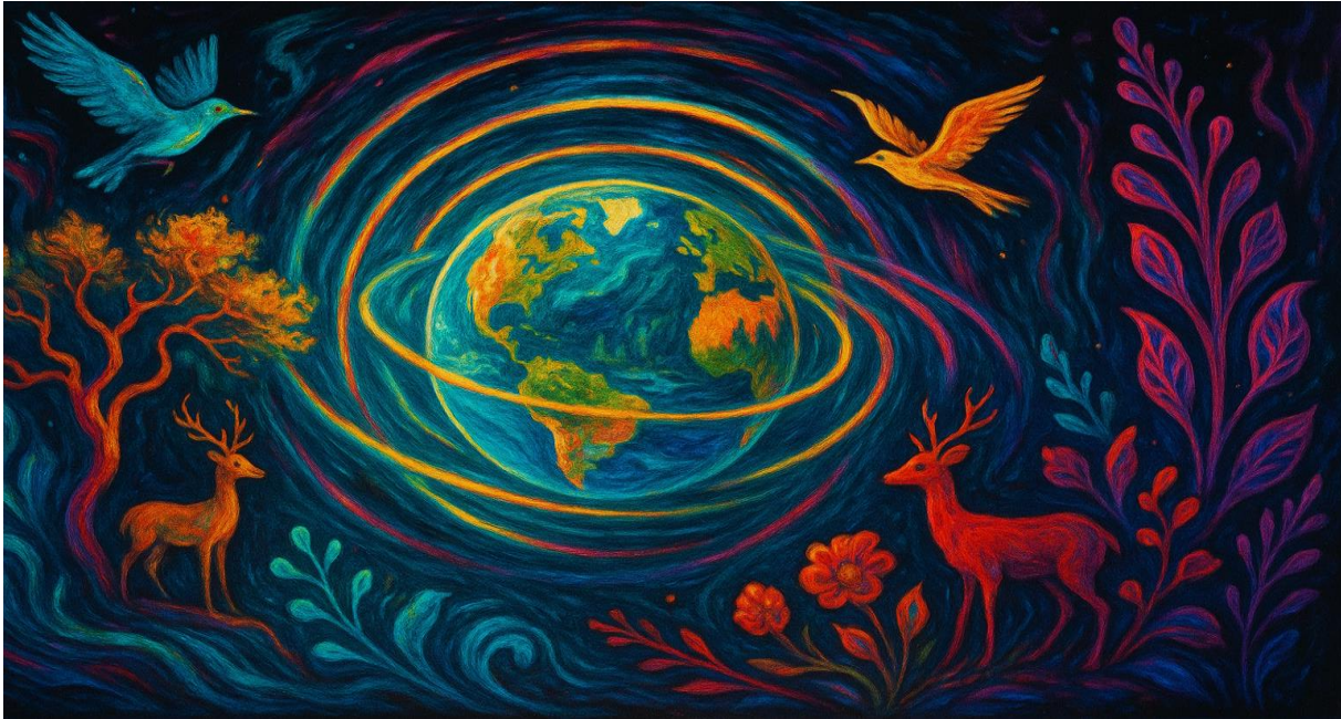
Abbildung 13 „Erde atmet in Kreisen.“

Ökologische Kybernetik zeigt auch, dass Nachhaltigkeit nicht mit starrer Kontrolle zu erreichen ist. Sie verlangt flexible, lernende Systeme. Gesellschaften müssen in der Lage sein, auf Rückmeldungen der Natur zu reagieren, Fehler zu korrigieren, Strategien anzupassen. Das bedeutet, dass Politik, Wirtschaft und Kultur sich als Teil ökologischer Regelkreise begreifen müssen.