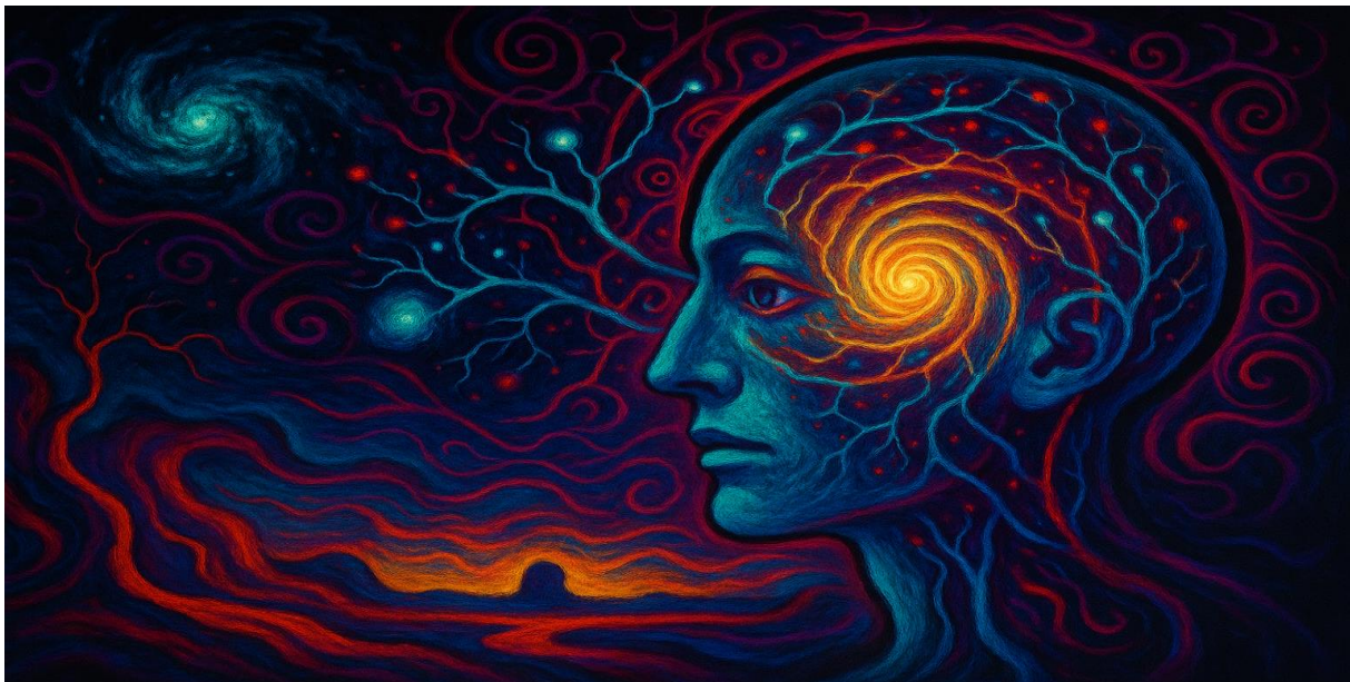
Abbildung 9 „Augen sehen nach innen.“

Die Kybernetik zweiter Ordnung bereitete den Boden für dieses Denken. Wenn jedes System sich selbst beobachtet, dann ist Bewusstsein vielleicht die höchste Form solcher Selbstbeobachtung: ein System, das nicht nur auf Umwelt reagiert, sondern sich selbst zum Gegenstand seiner eigenen Prozesse macht.