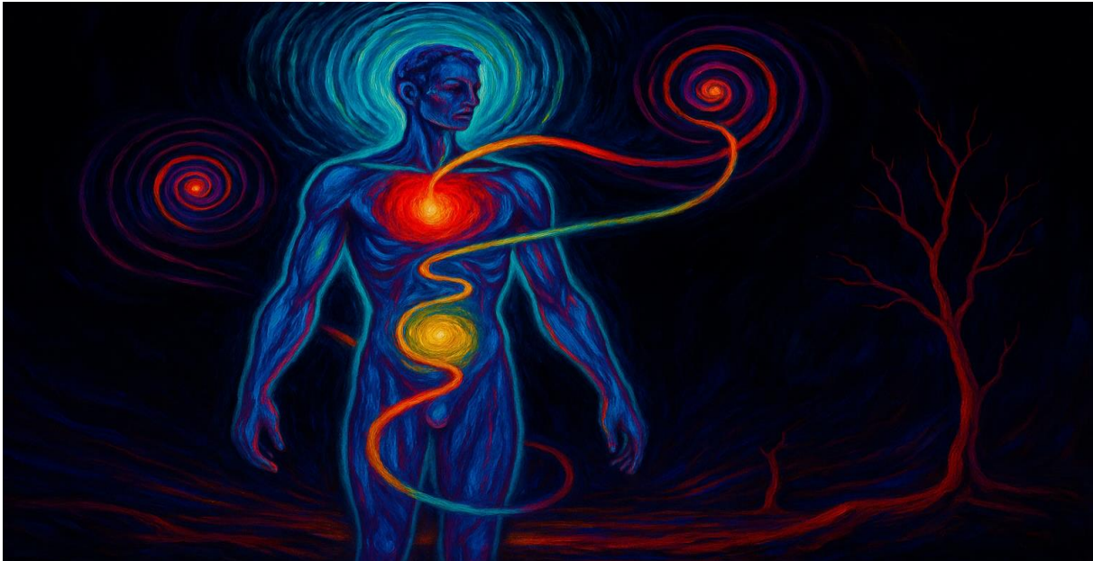
Abbildung 11 „Körper spiegelt inneres Fühlen.“

Auch Intuition lässt sich so verstehen. Sie ist kein geheimnisvolles Bauchgefühl, sondern das Ergebnis unzähliger unbewusster Rückkopplungen. Ein erfahrener Arzt, der blitzschnell eine Diagnose stellt, oder eine Musikerin, die im Moment die richtige Note findet – sie alle greifen auf Muster zurück, die sich über Jahre in kybernetischen Schleifen eingeschliffen haben. Intuition ist implizites Wissen, verdichtet in Feedbackprozessen.