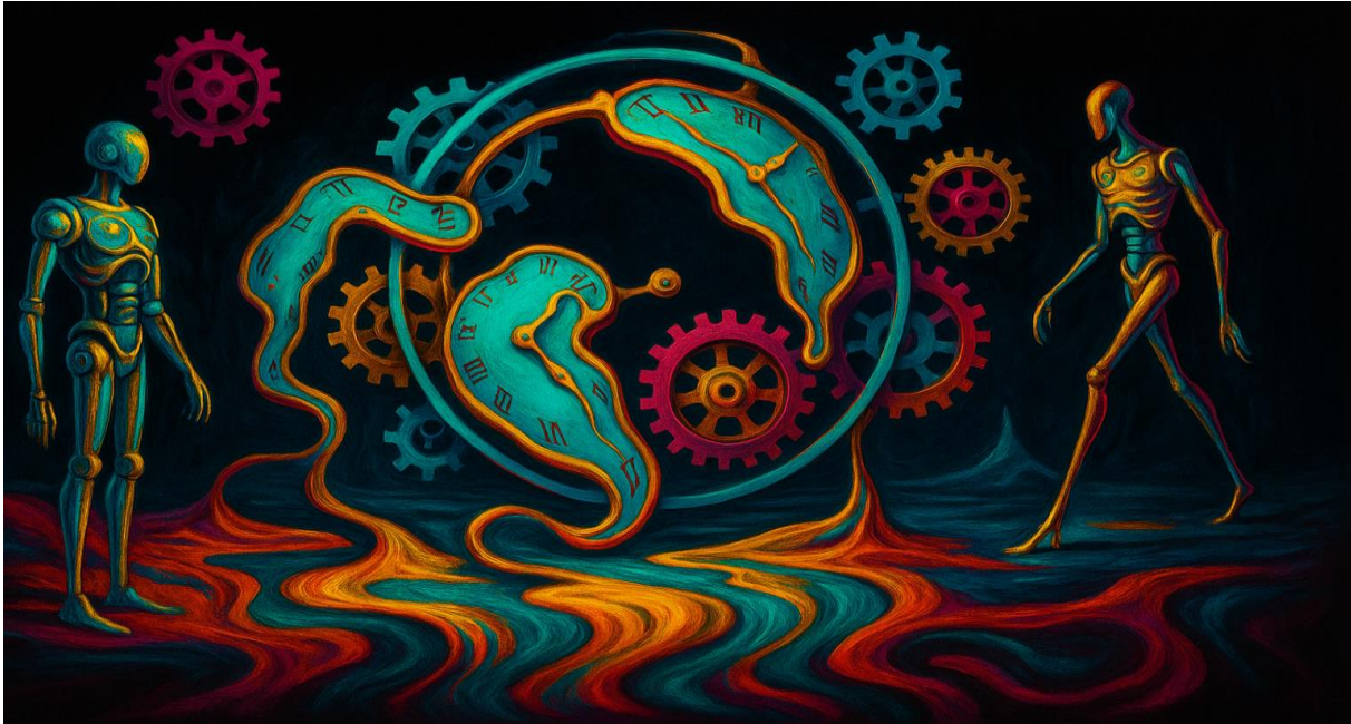
Abbildung 4 „Maschinen träumen im Kreis.“

Die 1940er Jahre sahen die Geburt der ersten elektronischen Computer. ENIAC in den USA war noch riesig und schwerfällig, aber er zeigte, was möglich war. Bald folgten kompaktere Modelle, und mit ihnen kam das Gefühl, dass Maschinen nicht nur rechnen, sondern lernen könnten. In Wieners Kybernetik fanden Ingenieure und Mathematiker eine Sprache, um Maschinen nicht nur als Werkzeuge, sondern als Systeme mit Rückkopplung zu verstehen.