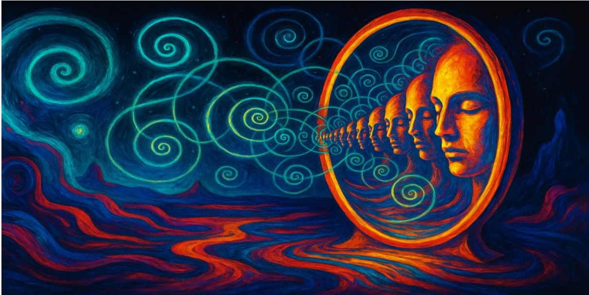
Abbildung 10 „Spiegel formen das Selbst.“

Diese Sichtweise wirft ein neues Licht auf Fragen der Identität in einer globalisierten Welt. Unsere Selbstbilder sind heute plural, fragmentiert, ständig in Bewegung. Digitale Medien eröffnen Räume, in denen Menschen verschiedene Identitäten ausprobieren, darstellen, verwerfen. Das Internet ist ein gigantisches Spiegelkabinett, in dem sich Selbstmodelle multiplizieren und überlagern. Kybernetisch betrachtet ist das kein Defizit, sondern Ausdruck einer neuen Dynamik: Identität wird flüssiger, feedback-gesteuert, adaptiv.