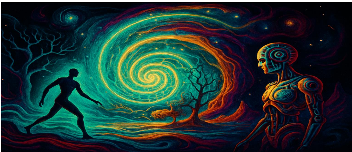
Abbildung 15 „Alles kreist in Einheit.“

Im 21. Jahrhundert stehen wir vor Herausforderungen, die lineares Denken überfordern: Klimawandel, digitale Transformation, globale Vernetzung. Hier wird die Kybernetik zu einem Kompass. Sie zeigt, dass Systeme nur dann überleben, wenn sie lernen, wenn sie Rückkopplungen ernst nehmen, wenn sie flexibel und adaptiv bleiben.