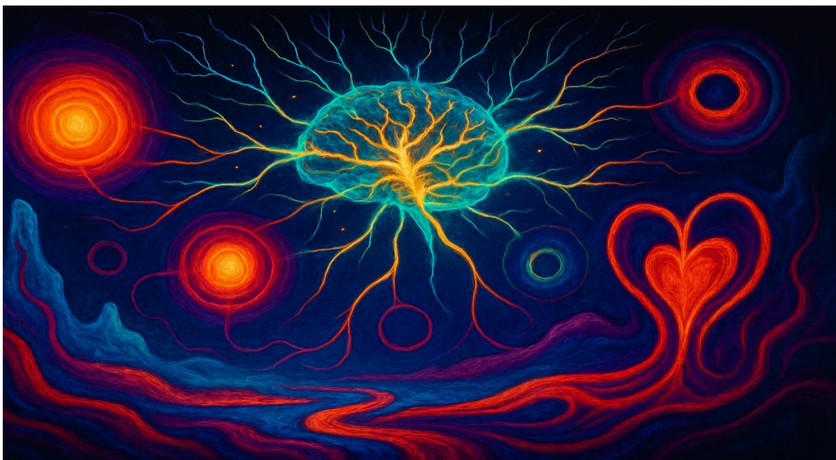
Abbildung 3 „Nerven leuchten im Gewebe.“

Auch in der Evolution finden wir kybernetische Muster. Charles Darwin beschrieb Selektion als Anpassung an Umweltbedingungen. Heute lässt sich sagen: Evolution ist ein riesiger kybernetischer Prozess, in dem genetische Variationen getestet, Rückmeldungen aus der Umwelt empfangen und erfolgreiche Strategien verstärkt werden. Gene, Organismen und Ökosysteme bilden ein Netzwerk von Rückkopplung, das Leben über Milliarden Jahre stabil und zugleich veränderlich gemacht hat.