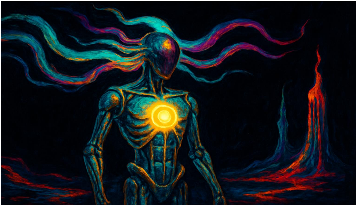
Abbildung 12 „Maschinen träumen von Seele.“

Die moderne künstliche Intelligenz hat die Debatte verschärft. Systeme, die lernen, Sprache zu verstehen, Bilder zu deuten, Entscheidungen zu treffen, zeigen Fähigkeiten, die einst als rein menschlich galten. Doch bleibt die Frage: Rechnen sie nur – oder erleben sie etwas?