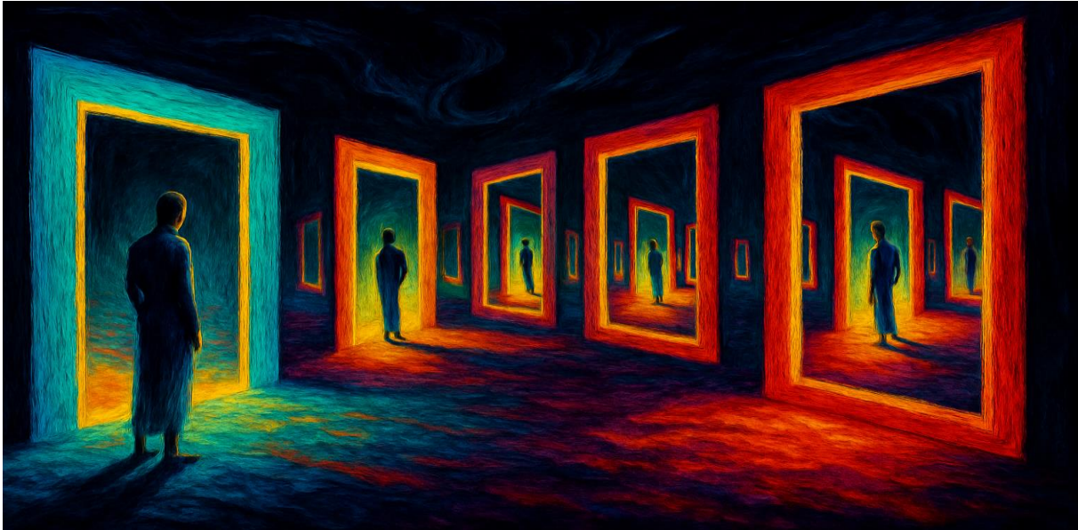
Abbildung 8 „Spiegel sehen sich selbst.“

Von Foerster prägte auch den Ausdruck der „nicht-trivialen Maschine“. Während eine triviale Maschine stets gleich reagiert – wie ein Taschenrechner –, zeigt eine nicht-triviale Maschine eine Geschichte, sie verändert sich durch frühere Erfahrungen. Menschen sind nicht-triviale Maschinen, weil sie lernen, sich erinnern und neue Verknüpfungen bilden. Jede Beobachtung verändert das System, das beobachtet wird, und das macht Prognosen so schwierig.