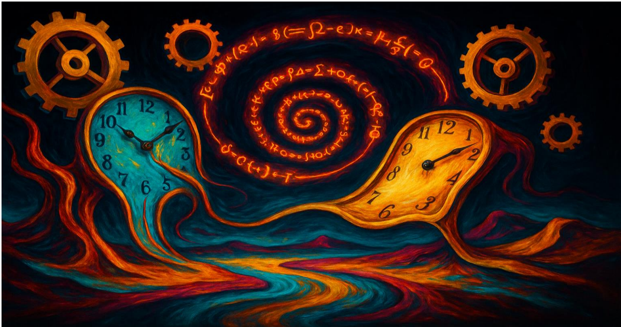
Abbildung 2 „Kreise tanzen im Gleichgewicht.“

organisieren.“ Diese Freiheit ist nicht grenzenlos, sie ist eingebettet in Regeln, die sich aus dem Zusammenspiel der Elemente ergeben.