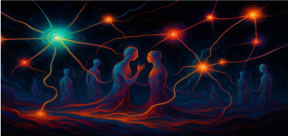
Abbildung 7 „Stimmen verweben das Netz.“

In dieser Sichtweise wird deutlich, warum Gesellschaften nicht einfach planbar sind. Sie sind keine Maschinen, die man von außen steuern könnte. Jede Intervention erzeugt Rückkopplungen, oft unvorhersehbar. Politische Entscheidungen haben Nebenwirkungen, technische Innovationen verändern Kommunikationsmuster, kulturelle Bewegungen entziehen sich jeder Kontrolle. Gesellschaft ist ein offenes System, das sich selbst reguliert.