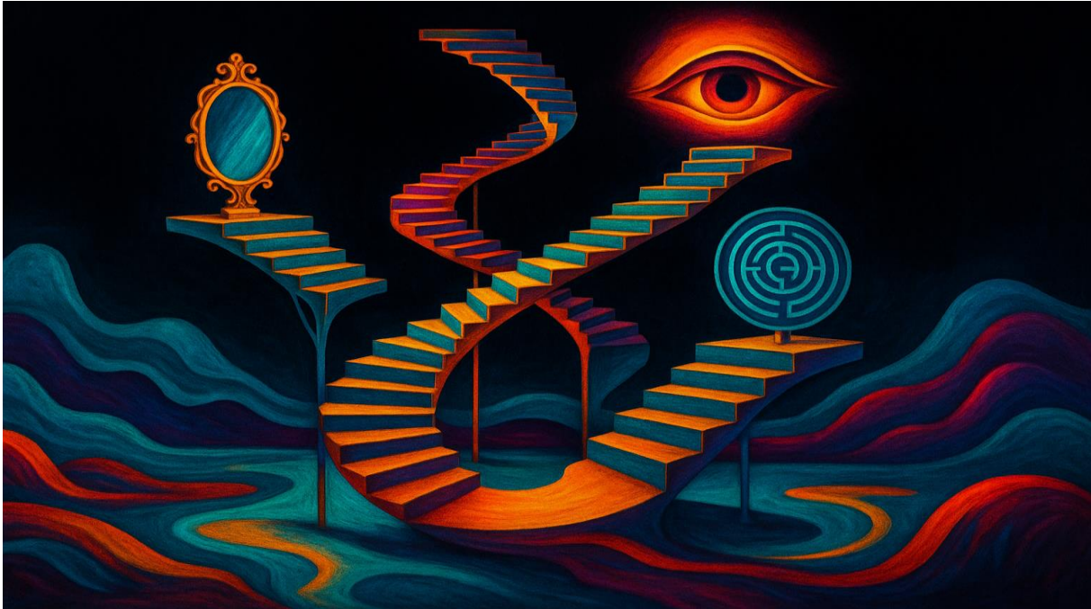
Abbildung 6 „Treppen führen durch Ebenen.“

Batesons Modell der Lernebenen ist kybernetisch, weil es Rückkopplung auf mehreren Ebenen beschreibt. Nicht nur Verhalten wird gesteuert, sondern auch die Muster, nach denen Verhalten gelernt wird. Diese Verschachtelung macht klar, warum Lernen ein so komplexer Prozess ist. Ein Schüler, der Vokabeln paukt, bewegt sich auf Lernen I. Wenn er erkennt, wie er sich selbst motivieren kann, betritt er Lernen II. Wenn er in einer Lebenskrise begreift, dass Sprache nicht nur ein Werkzeug, sondern ein Medium der Selbstverwirklichung ist, hat er etwas von Lernen III erfahren.