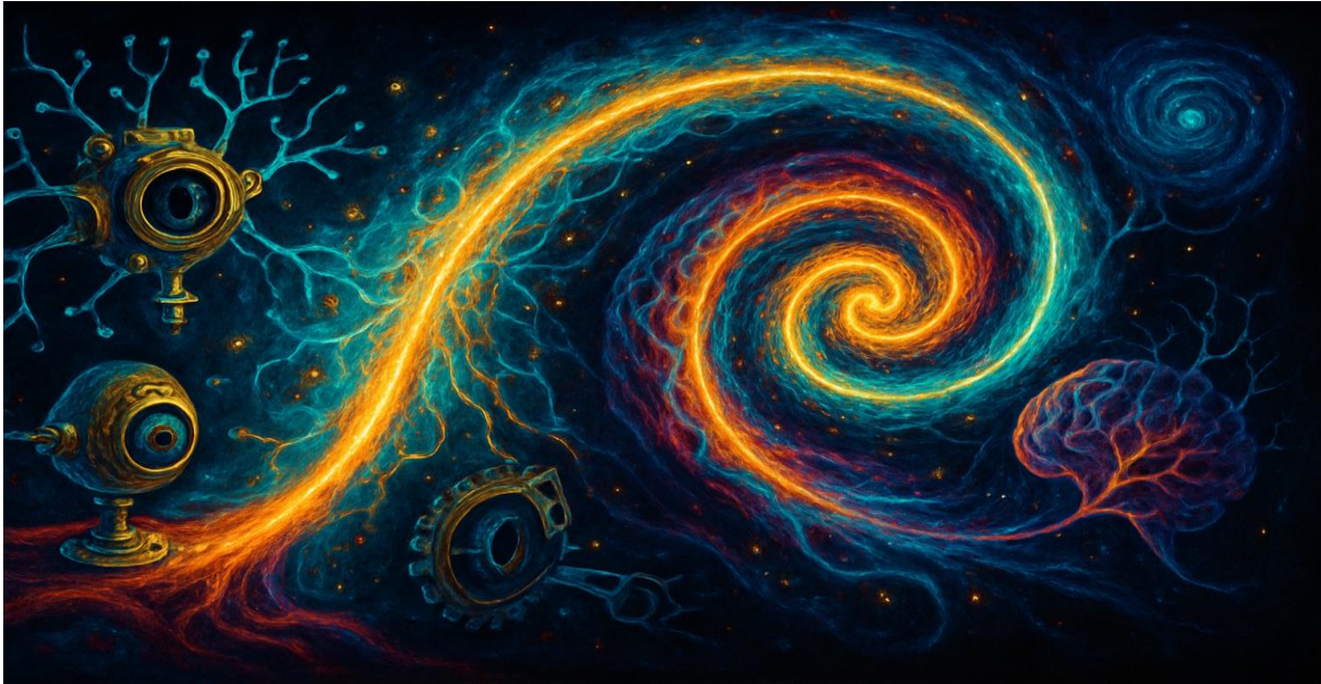
Abbildung 1 „Leuchtspiralen verbinden verborgene Systeme.“

Wenn man das Prinzip der Kybernetik in einem Bild zusammenfassen müsste, dann wäre es der Kreis. Kein Kreis des bloßen Wiederholens, sondern ein dynamischer Regelkreis: ein Prozess, der auf Rückmeldungen reagiert, sich selbst steuert, sich korrigiert und dabei lernfähig bleibt. Dieses Grundmotiv begegnet uns überall: im Thermostat, das eine Wohnung temperiert; im Herzschlag, der den Körper in Balance hält; in der Kommunikation zwischen zwei Menschen, die sich gegenseitig zuhören und reagieren. Rückkopplung – Feedback – ist das Herzstück kybernetischen Denkens.